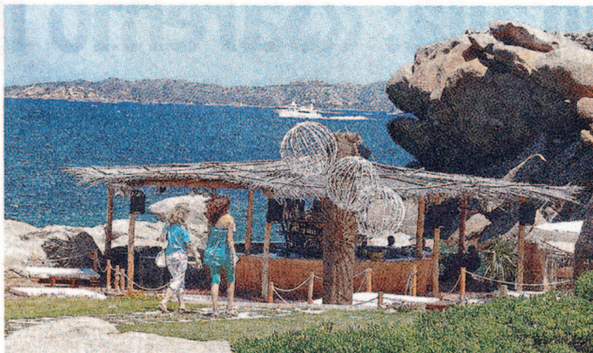
Il locale frequentato dal cantante dei Rolling Stones Mick Jagger