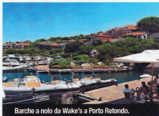
Barche a nolo da Wake's a Porto Rotondo.