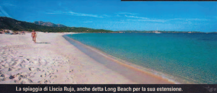
La spiaggia di Liscia Ruja, anche detta Long Beach per la sua estensione.