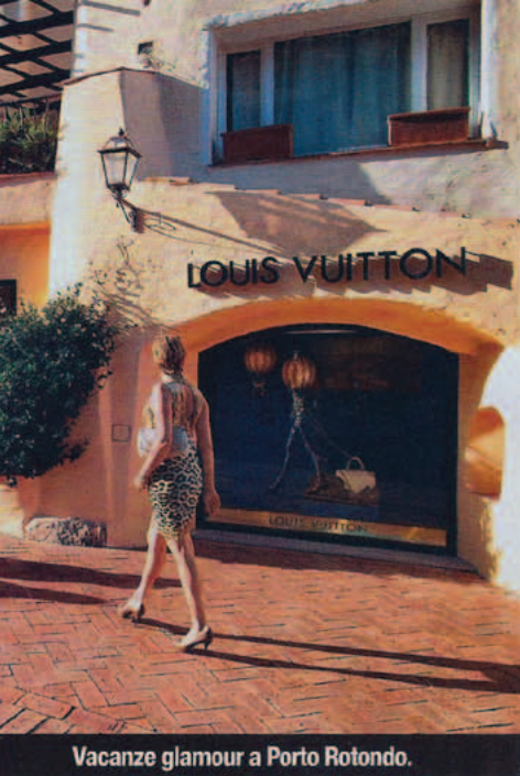
Vacanze glamour a Porto Rotondo.