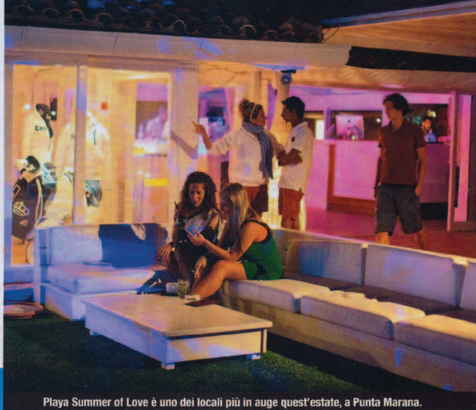
Playa Summer of Love è uno dei locali più in auge quest'estate, a Punta Marana.