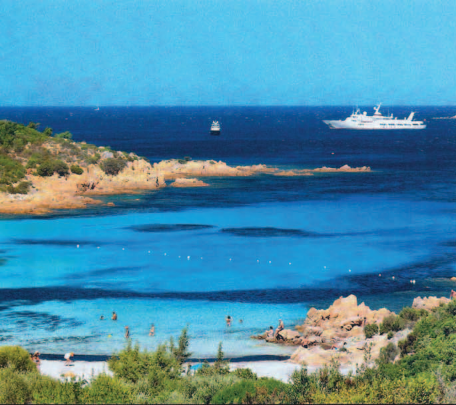
La spiaggia del Principe è una delle preferite dai vip... e dai paparazzi.

lusso e sfrenata mondanità conserva intatta la sua bellezza autentica. Il mare senza uguali che lambisce le coste è l'altro buon motivo per preferire queste località come meta per le vacanze. Tra Porto Cervo e Porto Rotondo si trovano spiagge incantevoli e non resta che l'imbarazzo della scelta, magari affidandosi anche in questo caso alla scia di passaparola che scandisce le giornate smeraldine. Il popolo della notte si ritrova nella più famosa tra le spiagge di Cala di Volpe, Liscia Ruja ribattezzata dai turisti Long Beach, formata in realtà da tante piccole calette orlate dai ginepri. La spiaggia è animatissima, complici anche i lussuosi yachts ormeggiati in rada, offre tutti i servizi, ogni tipo di sport acquatico e sembra quasi un suk in movimento per gli ambulanti che vanno avanti e indietro. Dentro il golfo, il punto noleggiato Treforsail, nel pontile sulla destra, offre il servizio di taxi-boat tanto amato dai vip, per spostarsi comodamente via mare da una spiaggia all'altra. Ma vale la pena decidere di noleggiare un'escursione in gommone con o senza driver per visitare le calette più belle della costa e di tutto l'arcipelago di La Maddalena. Se il tempo è molto buono si può raggiungere l'Isola Piana in Corsica separata dalla terraferma da una lingua di sabbia percorribile a piedi con la bassa marea. Ritornando non è possibile rinunciare a un