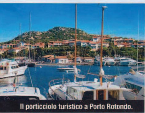
Il porticciolo turistico a Porto Rotondo.