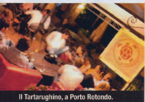
Il Tartarughino, a Porto Rotondo.

Gli ingredienti per un party perfetto? Tramonto in riva al mare, drink, buona musica. E il gioco è fatto. La stagione della Costa Smeralda si presenta puntuale all'appuntamento con la movida più glamour e luccicante dell'estate. Ogni anno fiumi di inchiostro raccontano la mondanità del jet set internazionale e ogni località echeggia dalle cronache gossipare dei giornali. I ricchi e famosi del mondo, i divi del grande e del piccolo schermo, i miti del calcio sfilano nelle incantevoli viuzze di Porto Cervo e Porto Rotondo . Le serate scorrono allegre sino al mattino. Un popolo in continuo movimento sempre a caccia dell'appuntamento "giusto" fa avanti e indietro lungo la panoramica da film che collega le due località. Ma cominciamo dall'aperitivo. Il Phi Beach di Baia Sardinia si riconferma anche quest'anno il tempio dell'happy hour in